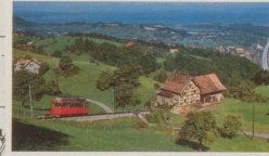
Bergbahn Rheineck-Walzenhausen RHW 9410 Heiden, Tel. 071/91 14 92 Rheineck – Walzenhausen