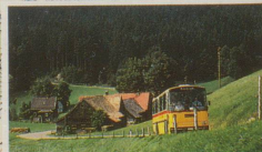
Postautos der Schweizerischen PTT-Betriebe erschliessen die Dörfer ohne Bahnverbindung.