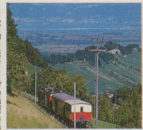
Rorschach-Heiden-Bergbahn RHB 9410 Heiden, Tel. 071/91 14 92 Rorschach – Heiden