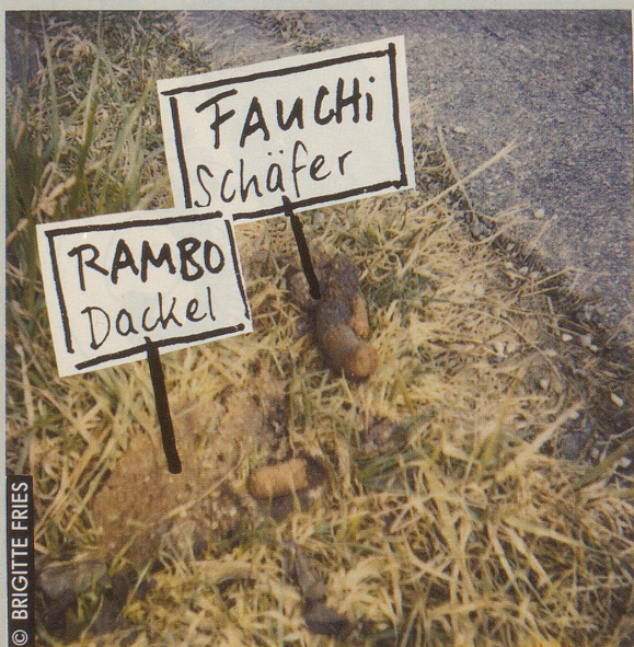
Rigi, Küssnacht (LU)