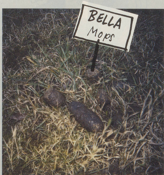
Rive Gauche, Genève