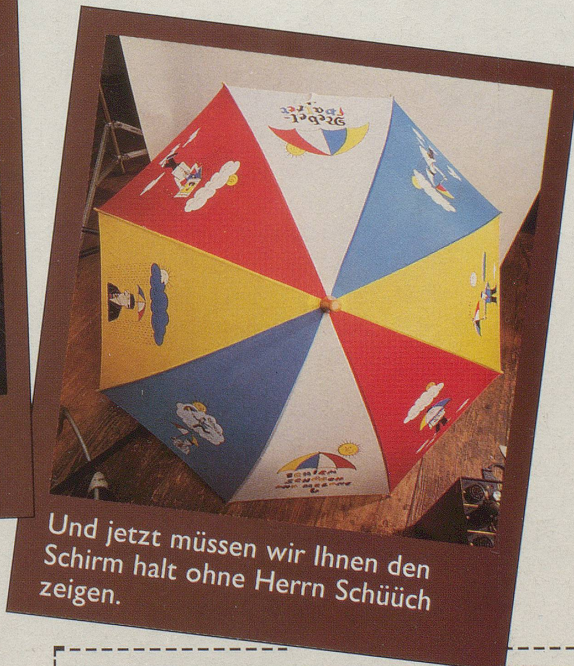
Und jetzt müssen wir Ihnen den Schirm halt ohne Herrn Schüüch zeigen.