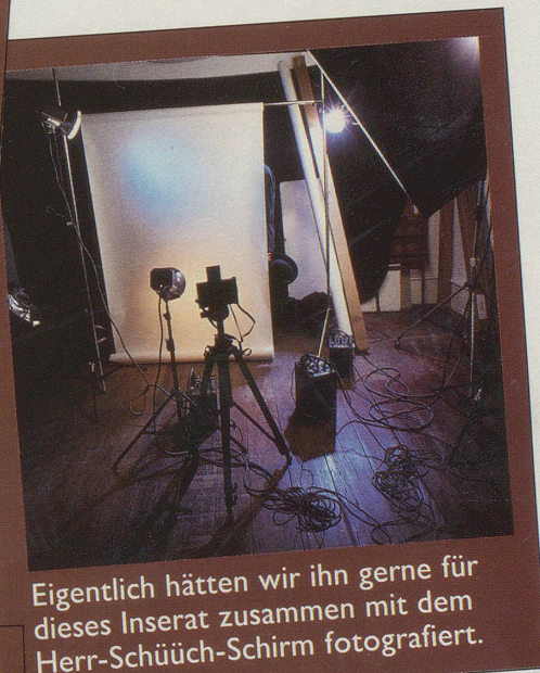
Eigentlich hätten wir ihn gerne für dieses Inserat zusammen mit dem Herr-Schüüch-Schirm fotografiert.