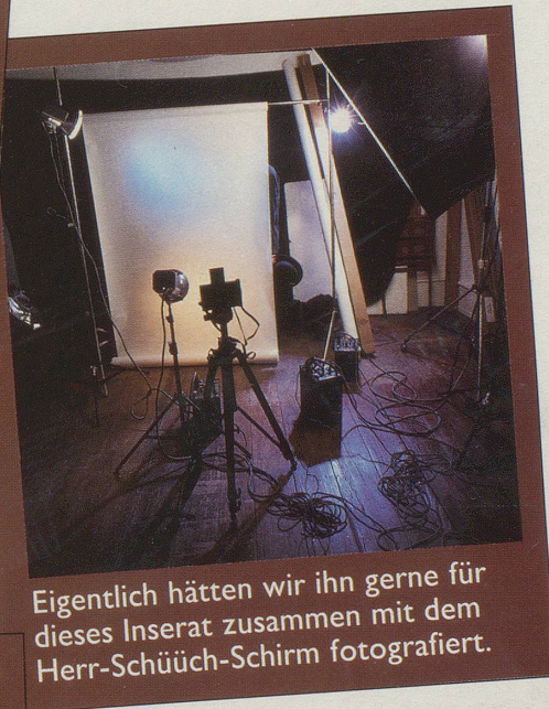
Eigentlich hätten wir ihn gerne für dieses Inserat zusammen mit dem Herr-Schüüch-Schirm fotografiert.