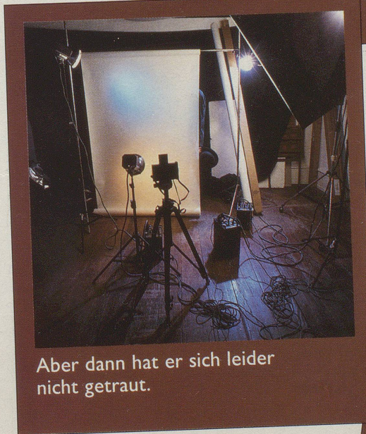
Aber dann hat er sich leider nicht getraut.