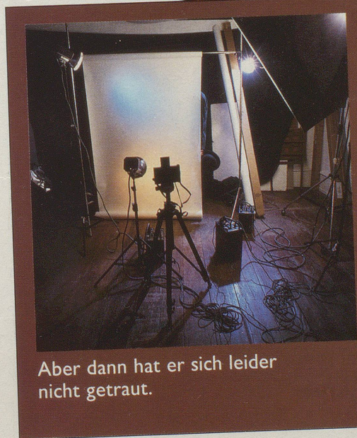
Aber dann hat er sich leider nicht getraut.