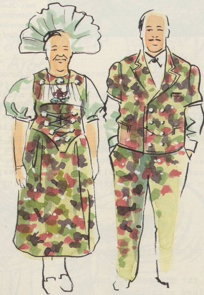
In diesem Gewand ans Chränzli, und Sie werden die Tombola gewinnen!

Gehen auch Sie mit der Zeit! Der neue Modetrend heisst «Fruchtig in den Schweizer Frühling», und was in den Kleidergeschäften auf Sie wartet, kann sich sehen lassen. Greifen Sie zu, 's het solang's het! Ihre Moderedaktion