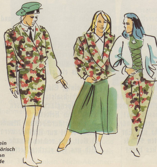
Es darf auch ein bisschen militärisch sein: Kollektion Soldatenfreude