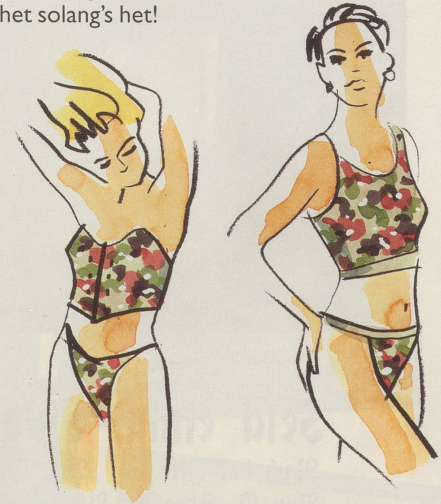
Die Frau mag's auch darunter chic: Kollektion Freunde junger Mädchen ...