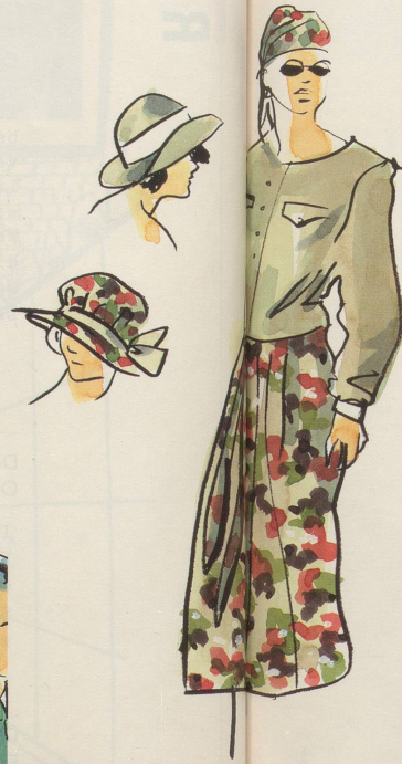
Da kann Frau natürlich nicht zurückstehen: Die Schweizerin ist chic und dem Manne treu!