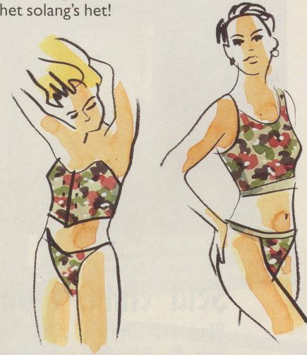
Die Frau mag's auch darunter chic: Kollektion Freunde junger Mädchen ...