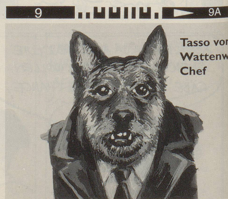
Und jetzt bin ich am Drücker!