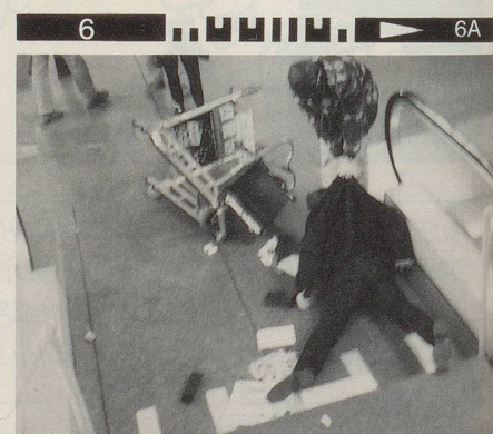
Verbrecher dürfen nicht mit Samthandschuhen ...