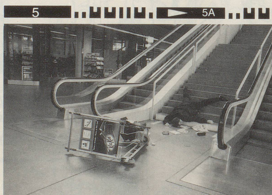
... aber kurz vor dem Zoll zu Fall gebracht.