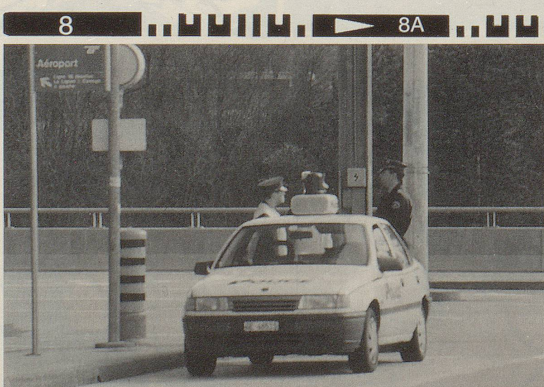
... bis ihn die Polizei abführt.