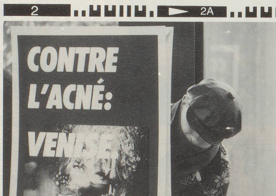
Das ist sinnlos, denn der Russ ist umzingelt!