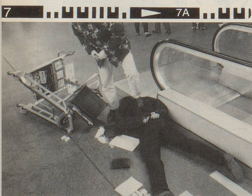
... angefasst werden! Hier wird der Ver- räter bewacht, ...