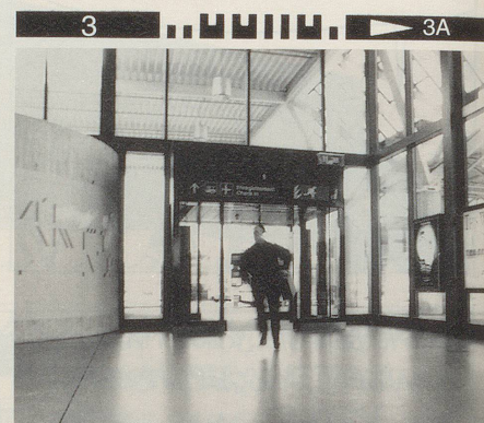
Verzweifelt versucht er, den Rechten zu entkommen, ...