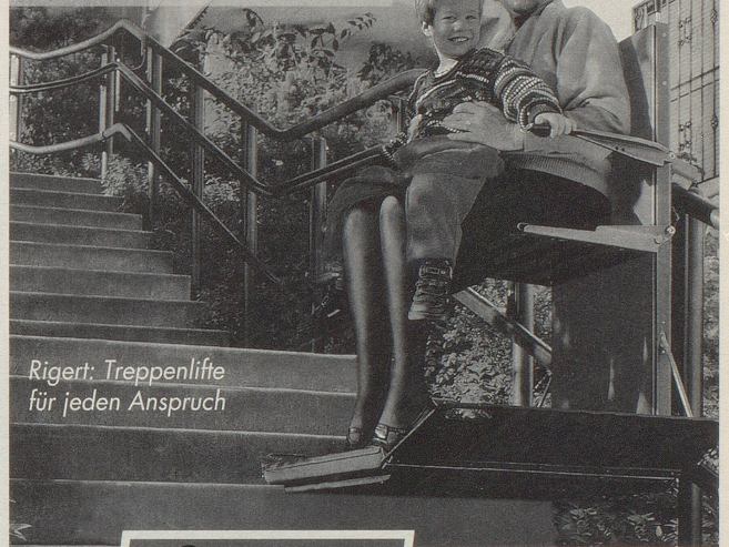
Rigert: Treppenlifte für jeden Anspruch

«Wir haben den Lift im Hinblick auf unsere alten Tage installiert und dabei gar nicht gedacht, wie nützlich er uns jetzt schon ist.»