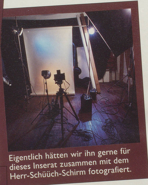
Eigentlich hätten wir ihn gerne für dieses Inserat zusammen mit dem Herr-Schüüch-Schirm fotografiert.