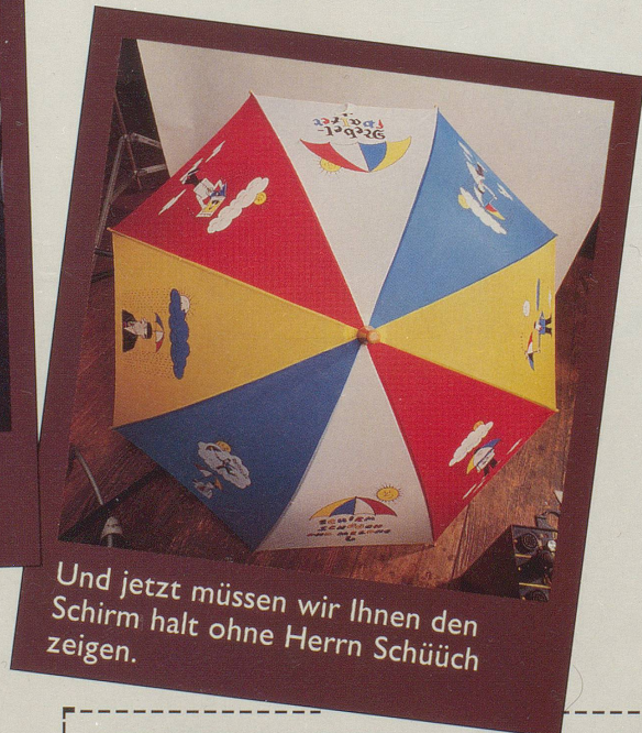
Und jetzt müssen wir Ihnen den Schirm halt ohne Herrn Schüüch zeigen.