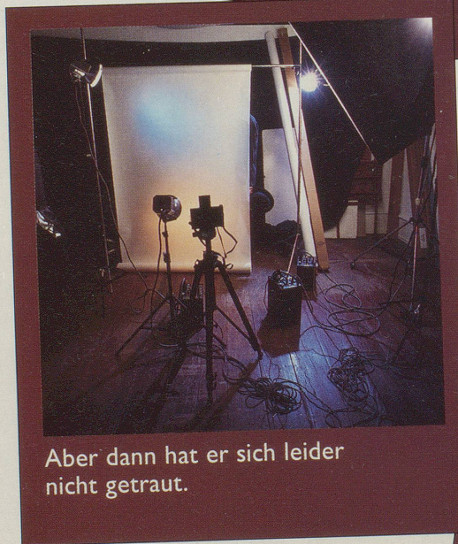
Aber dann hat er sich leider nicht getraut.