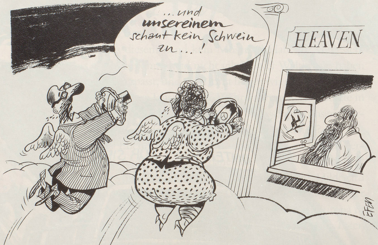
Das unspektakuläre Sterben auf unseren Strassen und der spektakuläre Tod Ulrike Maiers auf der vereisten Piste