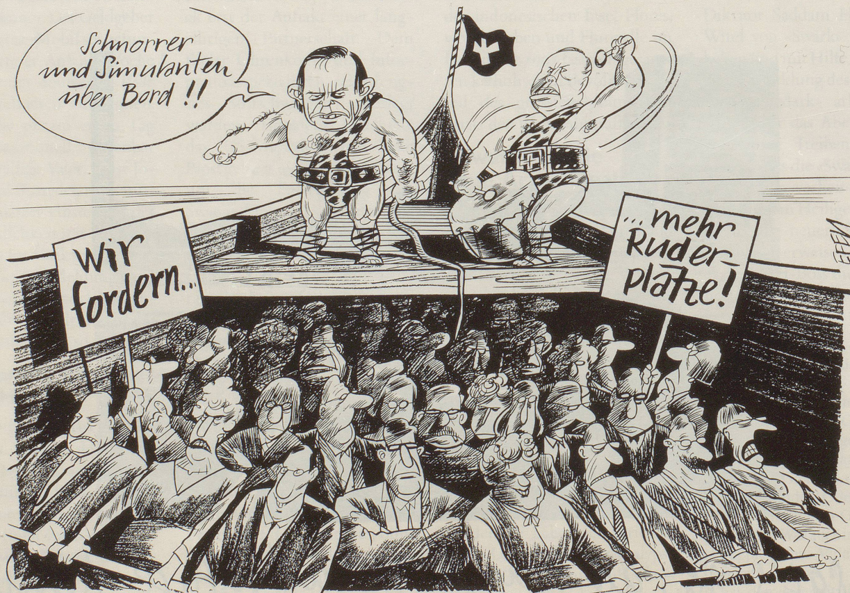
Bürgerliche Tonangeber und Einpeitscher ...