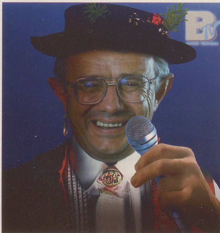
Greift selbst zum Mikrofon: Bunderat Arnold Koller

Manko.» Die heutige «Arena», verriet Koller dem SonntagsBlick , sei nur eine der möglichen Formen, er wünsche sich «ein neues Gefäss, das eine vertiefte Auseinandersetzung mit zwei oder drei Journalisten oder Bürgern über