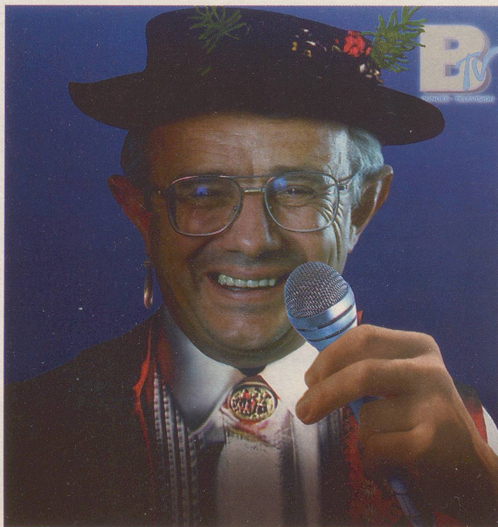
Greift selbst zum Mikrophon: Bunderat Arnold Koller

Manko.» Die heutige «Arena», verriet Koller dem SonntagsBlick , sei nur eine der möglichen Formen, er wünsche sich «ein neues Gefäss, das eine vertiefte Auseinandersetzung mit zwei oder drei Journalisten oder Bürgern über