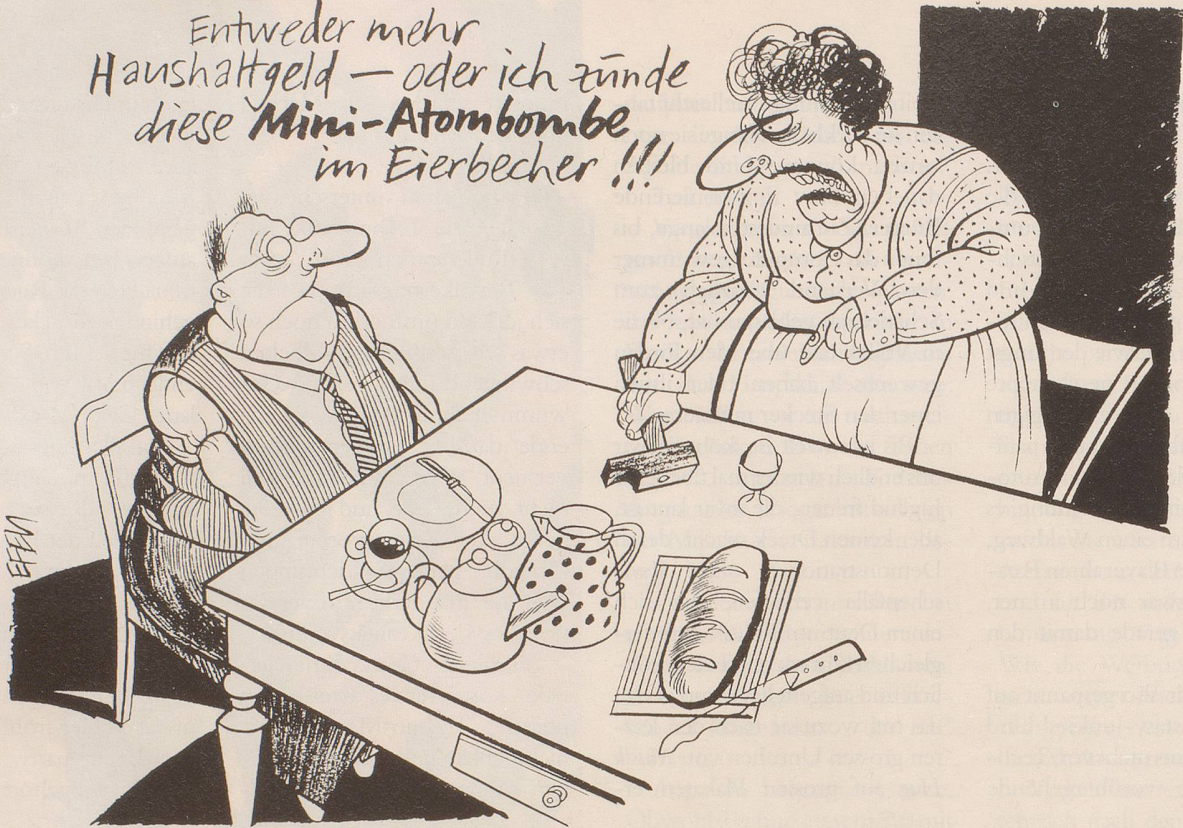
Plutonium-Schmuggel: Nuklear-Terrorismus Tür und Tor geöffnet?

Entweder mehr Haushaltsgeld — oder ich zünde diese Mini-Atombombe im Eierbecher !!!