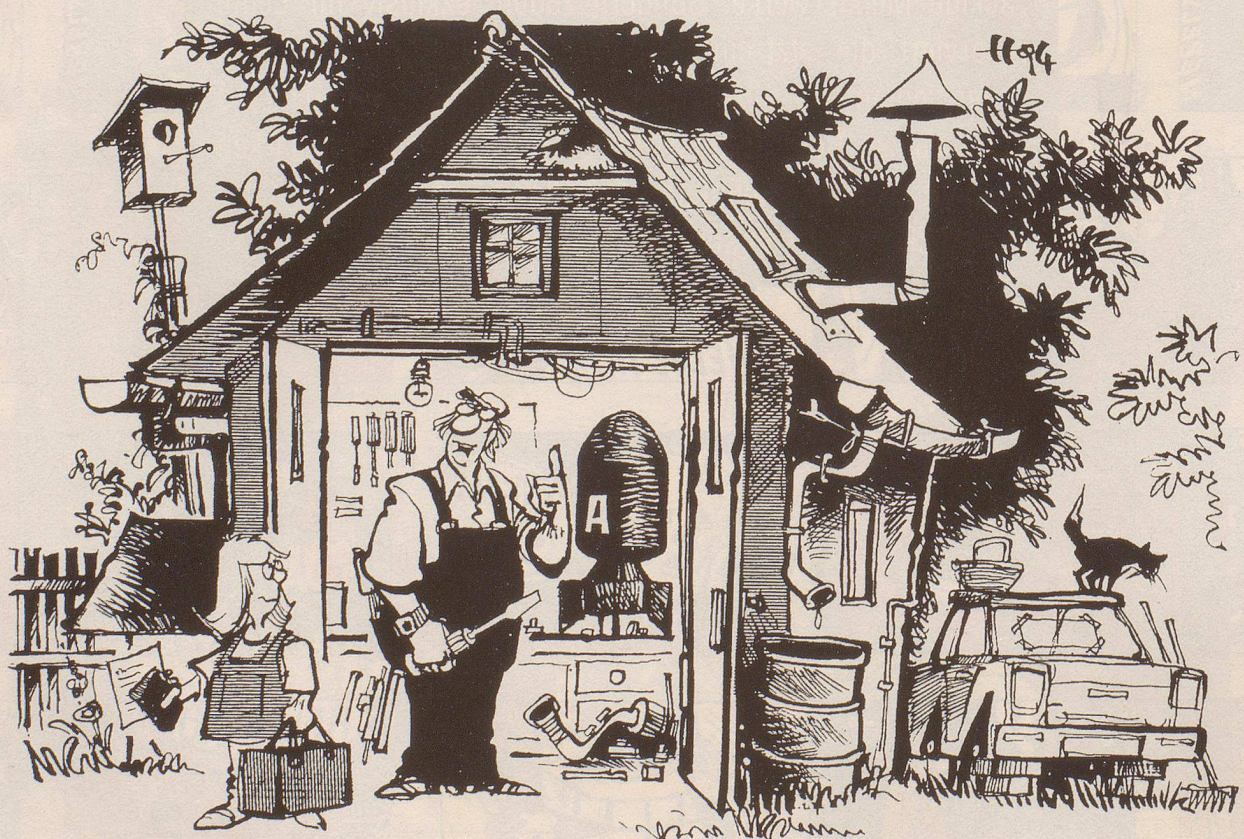
« ... Schachtel Zigaretten, Flasche Bier, ein halbes Kilo Plutonium 239 und die Wurstsemmeln nicht vergessen! »