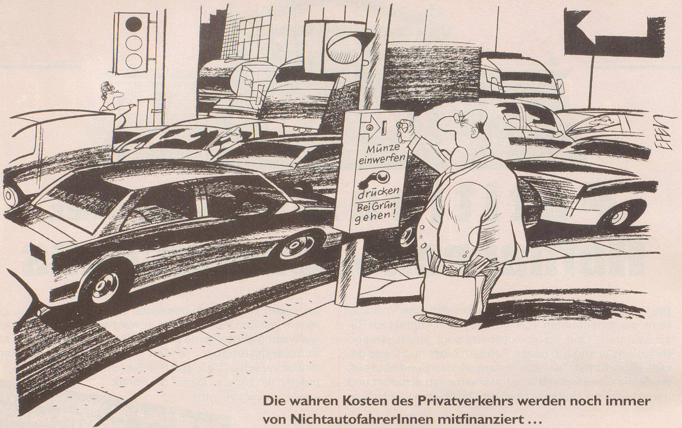
Die wahren Kosten des Privatverkehrs werden noch immer von NichtautofahrerInnen mitfinanziert ...