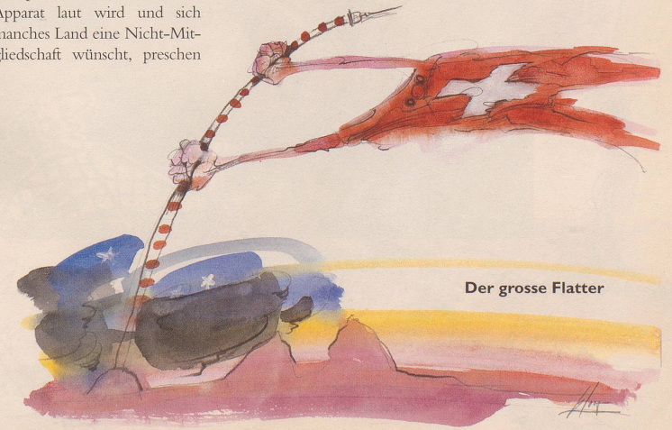
Der grosse Flatter

Damit gingen auch Millionen von Steuerfranken flöten, meinen Sie? Gegenfrage: Kennen Sie mehr als drei linke Oppositionelle, die vermögend sind und dem Staat so viele Steuern abliefern wie die meisten staatsstreuen Bürgerinnen und Bürger? Eben.