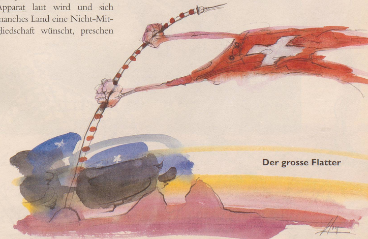
Der grosse Flatter

Damit gingen auch Millionen von Steuerfranken flöten, meinen Sie? Gegenfrage: Kennen Sie mehr als drei linke Oppositionelle, die vermögend sind und dem Staat so viele Steuern abliefern wie die meisten staatsstreuen Bürgerinnen und Bürger? Eben.