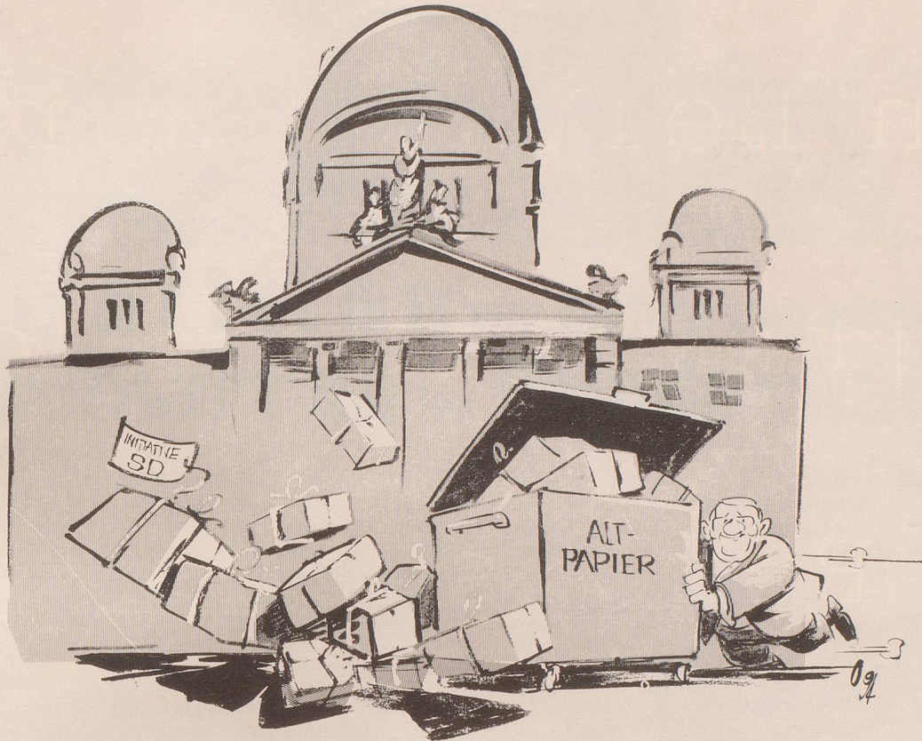
Es bewegt sich was.