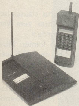
Eleganz und schnurloser Komfort: Libra von Ascom

Wer seine volle Bewegungsfreiheit braucht und trotzdem nicht auf den Komfort eines Telefons verzichten will braucht Ascom. Beispielsweise das neue schnurlose Telefon LIBRA. Weitgehend abhörsicher dank neuester Technologie.