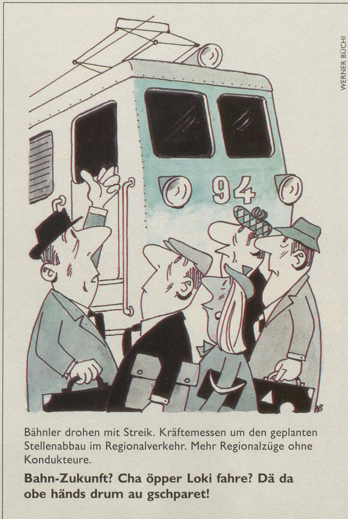
Bähnler drohen mit Streik. Krätemessen um den geplanten Stellenabbau im Regionalverkehr. Mehr Regionalzüge ohne Kondukteure.

Gegen Vorwürfe, diese Praxis widerspreche dem Gesetz der wirtschaftlichen Freiheit und Unabhängigkeit, wehrt sich die Schweizerische Multi-Vereinigung vehement: «Die Wirtschaft ist dann frei, wenn es uns gutgeht.» Gerade das Beispiel der Bauern zeige, wie wichtig die Erhaltung der Verbandsstrukturen sei. Ohne Beiträge der kleinen und mittleren Unternehmer, so der Verband, «könnten wir echtes Schweizer Fleisch nicht mehr absetzen, was zu einem geringeren Fleischkonsum und somit zum Abbau des Fleischberges führen würde.»