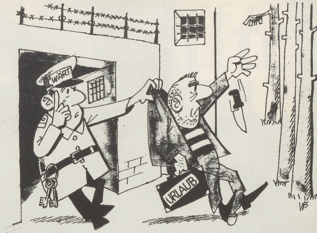
Urlaubssperre für Häftlinge

Die Gefängnisleitung zeigte sich nach getanem Job erleichtert: «Endlich können wir die Klage nach behindertengerechter Architektur als erledigt betrachten.»