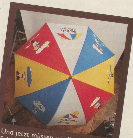
Und jetzt müssen wir Ihnen den Schirm halt ohne Herrn Schüüch zeigen.

Wir hoffen, dass Sie dies dem Herrn Schüüch nicht übelnehmen und den Schirm trotzdem bestellen. Denn eines können Sie sicher sein: Sein Schirm lässt Sie garantiert nie im Regen stehen! (Gezeichnet von Hans Moser und für Nebelspalter-Abonnenten zum Spezialpreis erhältlich: nur 39.— Franken. Nicht-Abonnenten 58.— Franken.)