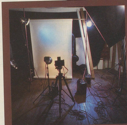
Aber dann hat er sich leider nicht getraut.