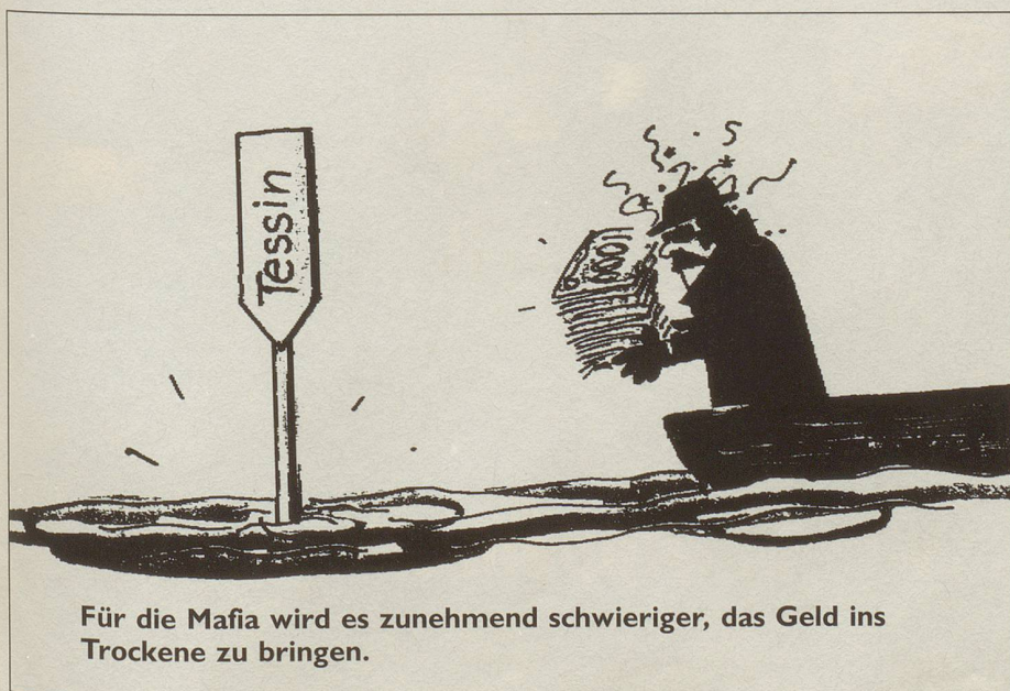
Für die Mafia wird es zunehmend schwieriger, das Geld ins Trockene zu bringen.

Bitte Coupon einsenden an: Nebelspalter-Verlag, 9400 Rorschach