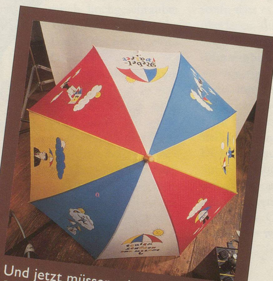
Und jetzt müssen wir Ihnen den Schirm halt ohne Herrn Schüüch zeigen.

Wir hoffen, dass Sie dies dem Herrn Schüüch nicht übelnehmen und den Schirm trotzdem bestellen. Denn eines können Sie sicher sein: Sein Schirm lässt Sie garantiert nie im Regen stehen! (Gezeichnet von Hans Moser und für Nebelspalter-Abonnenten zum Spezialpreis erhältlich: nur 39.— Franken. Nicht-Abonnenten 58.— Franken.)