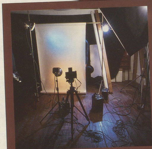
Aber dann hat er sich leider nicht getraut.