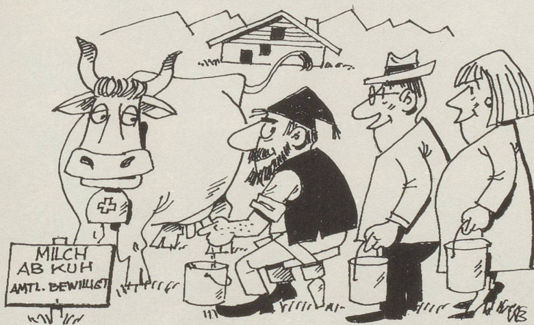
Milchordnung wird neu geregelt

Nach fünf Jahren, einwandfreier Leumund vorausgesetzt, dürfen sie über ein Drittel ihres Lohnes frei verfügen. Die Empfängnisverhütung ist Pflicht. Für jedes Kind muss ein begründeter, befristeter Antrag eingereicht werden. Zur Gesundheitsbetreuung sind Spezialärzte einzusetzen. Wir denken dabei an Studienabgänger, die sich so, praxisgerecht, in ihren schwierigen Beruf einarbeiten können. Grössere Investitionen, Autos, Wohnungseinrichtungen usw., bedürfen einer Sondergenehmigung. Ausländer sind ein weites Potential. Unser ausgereiftes Konzept trägt dem Rechnung. Beide Seiten haben so Gewähr für das einwandfreie Funktionieren neben- und miteinander.