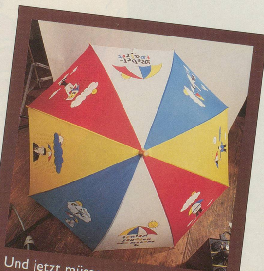
Und jetzt müssen wir Ihnen den Schirm halt ohne Herrn Schüüch zeigen.

Wir hoffen, dass Sie dies dem Herrn Schüüch nicht übelnehmen und den Schirm trotzdem bestellen. Denn eines können Sie sicher sein: Sein Schirm lässt Sie garantiert nie im Regen stehen! (Gezeichnet von Hans Moser und für Nebelspalter-Abonnenten zum Spezialpreis erhältlich: nur 39.— Franken. Nicht-Abonnenten 58.— Franken.)