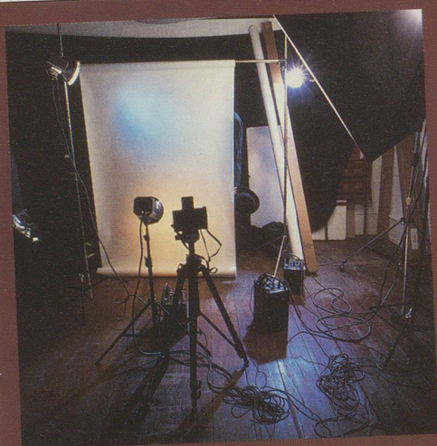
Aber dann hat er sich leider nicht getraut.