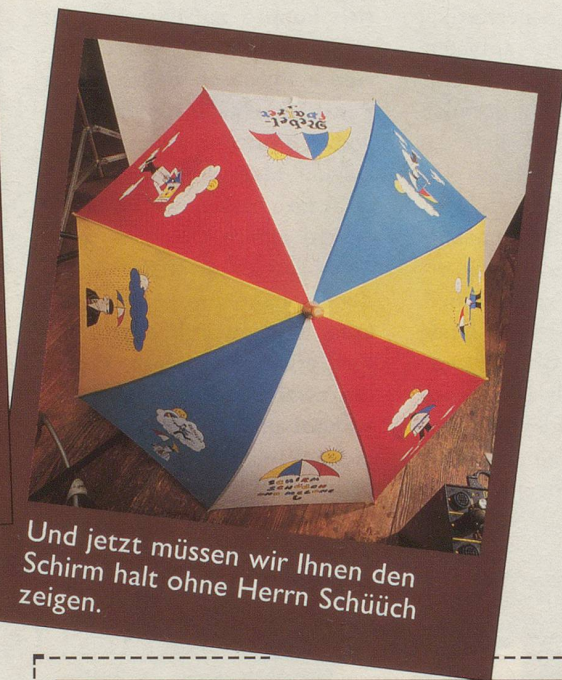
Und jetzt müssen wir Ihnen den Schirm halt ohne Herrn Schüüch zeigen.

Wir hoffen, dass Sie dies dem Herrn Schüüch nicht übelnehmen und den Schirm trotzdem bestellen. Denn eines können Sie sicher sein: Sein Schirm lässt Sie garantiert nie im Regen stehen! (Gezeichnet von Hans Moser und für Nebelspalter -Abonnenten zum Spezialpreis erhältlich: nur 39.— Franken. Nicht-Abonnenten 58.— Franken.)