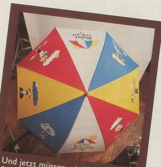
Und jetzt müssen wir Ihnen den Schirm halt ohne Herrn Schüüch zeigen.

Wir hoffen, dass Sie dies dem Herrn Schüüch nicht übelnehmen und den Schirm trotzdem bestellen. Denn eines können Sie sicher sein: Sein Schirm lässt Sie garantiert nie im Regen stehen! (Gezeichnet von Hans Moser und für Nebelspalter-Abonnenten zum Spezialpreis erhältlich: nur 39.— Franken. Nicht-Abonnenten 58.— Franken.)