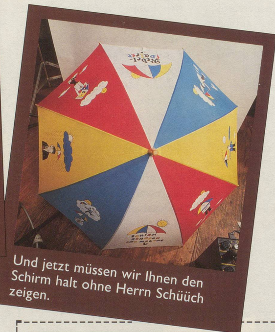
Und jetzt müssen wir Ihnen den Schirm halt ohne Herrn Schüüch zeigen.

Wir hoffen, dass Sie dies dem Herrn Schüüch nicht übelnehmen und den Schirm trotzdem bestellen. Denn eines können Sie sicher sein: Sein Schirm lässt Sie garantiert nie im Regen stehen! (Gezeichnet von Hans Moser und für Nebelspalter -Abonnenten zum Spezialpreis erhältlich: nur 39.— Franken. Nicht-Abonnenten 58.— Franken.)