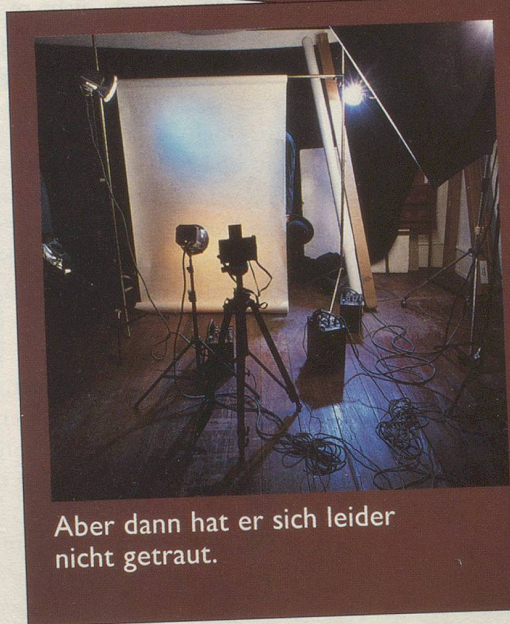
Aber dann hat er sich leider nicht getraut.