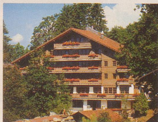
HOTEL RESTAURANT CAPRICE ****