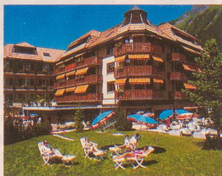
★★★★ Hotel Silberhorn 3823 Wengen

Hedy Graf, Hotel Caprice CH-3823 Wengen Tel. 036 55 41 41 Fax 036 55 41 44