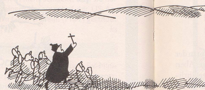
Die Verschiebung der Hölle