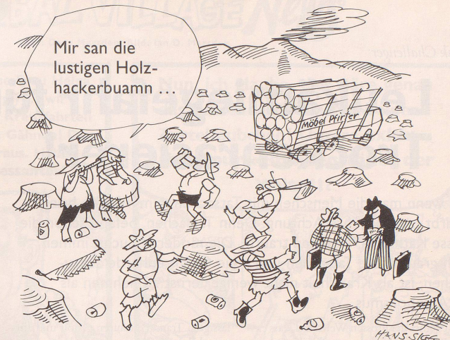
Es war im Regenwald, wo meine Wiege stand ...