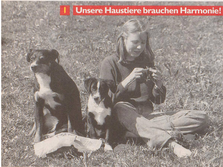
1 Unsere Haustiere brauchen Harmonie!