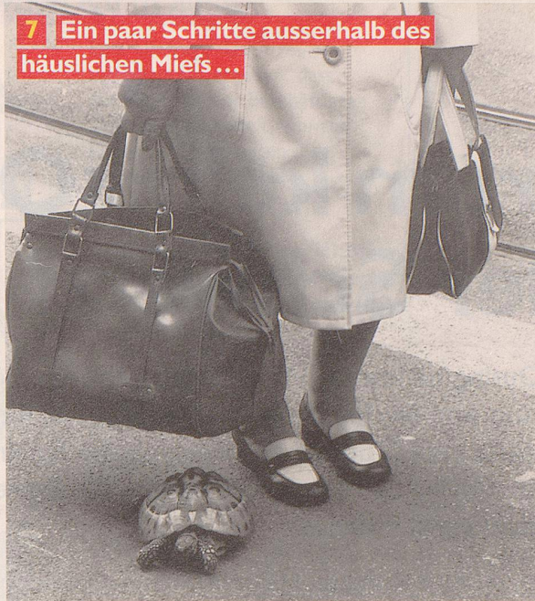
7 Ein paar Schritte ausserhalb des häuslichen Miefs ...