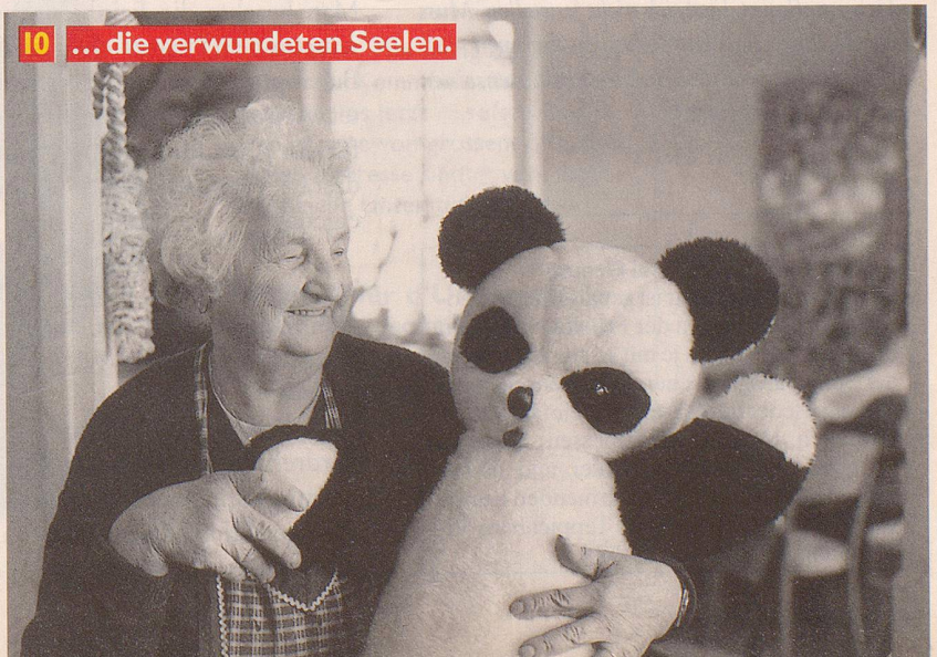
10 ... die verwundeten Seelen.

Sweeping Reforms: Reshape Korea's Society