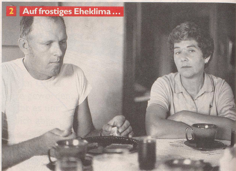
2 Auf frostiges Eheklima ...