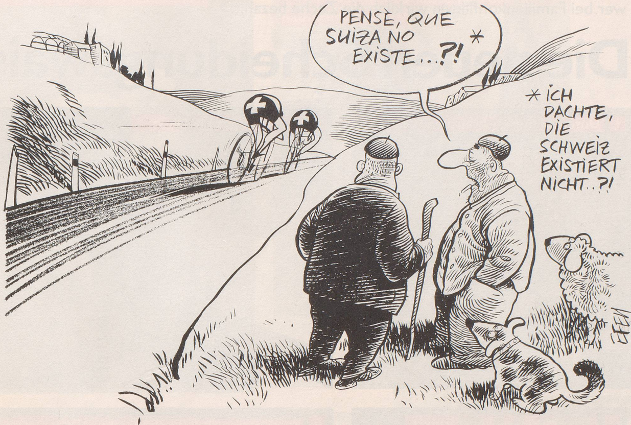
Toni Rominger und Alex Zülle bewiesen in der Spanien-Rundfahrt, dass die Schweiz – im Gegensatz zur berüchtigten Behauptung im Schweizer Pavillon an der Weltausstellung in Sevilla – sehr wohl existiert ...