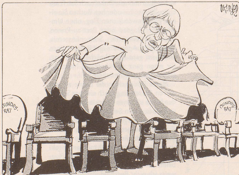
Sesseltanz um Frauenquote