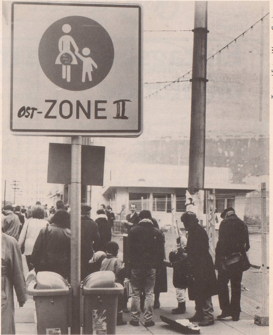
8 Doch wenn man die Lage nüchtern betrachtet, ...