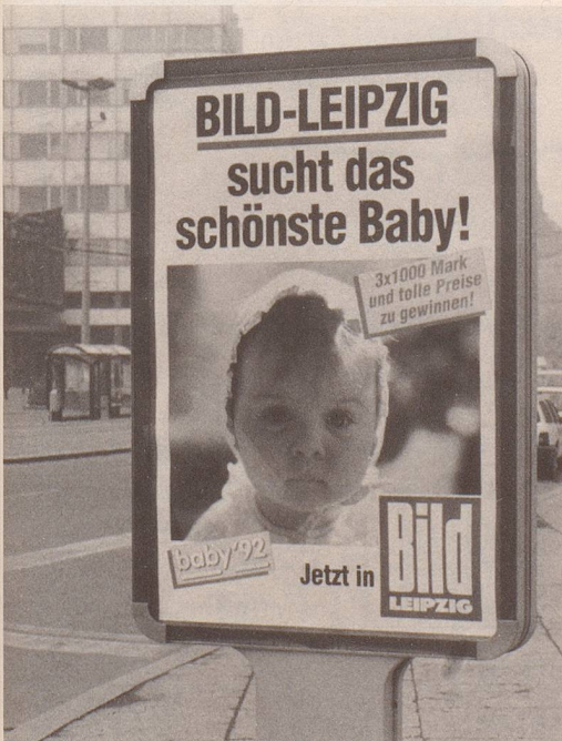
7 ... besser und schöner!