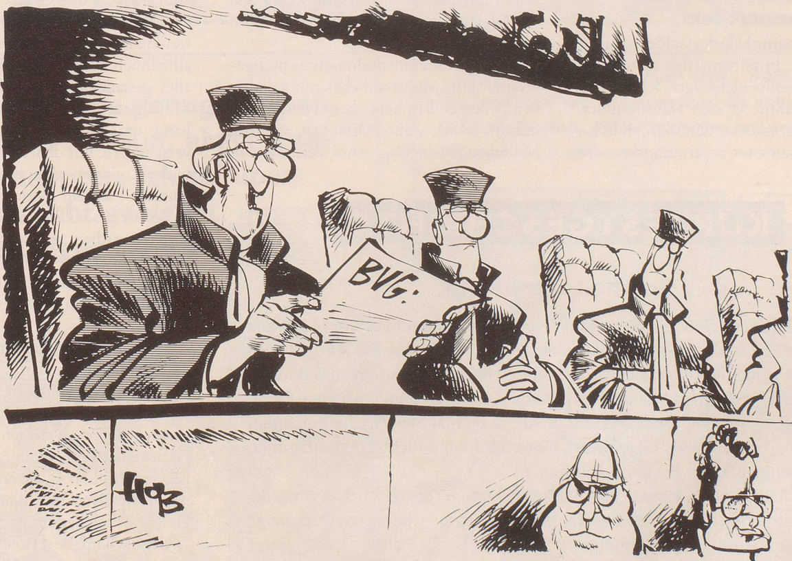
«Wir haben folgende Entscheidung der Bundesregierung beschlossen ...»