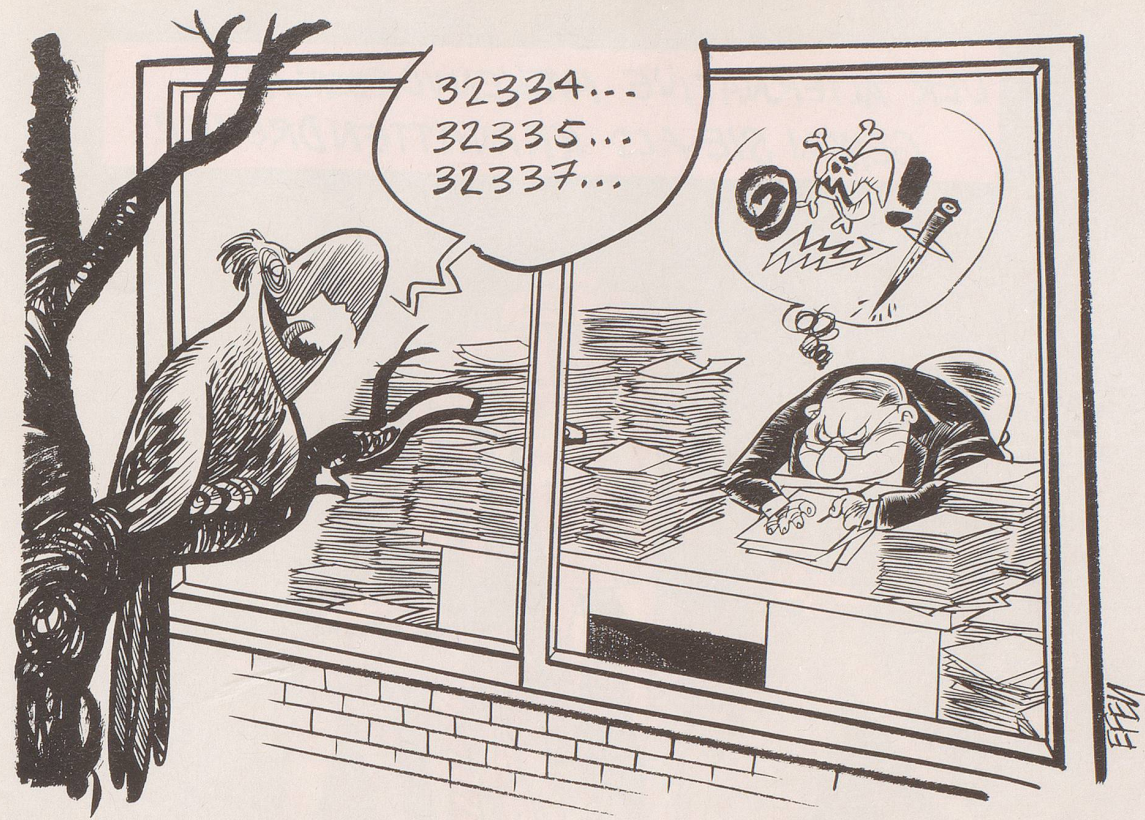
Aus unerfindlichen Gründen haben sich die Bundesbeamten beim Zählen der Unterschriften für das NEAT-Referendum verrechnet ...