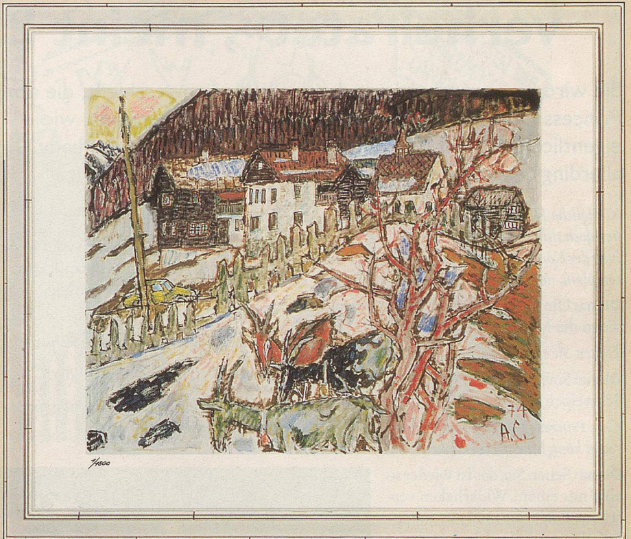
«Blick ins Dorf», Format 67,8 x 80 cm

Jedes Blatt ist numeriert, wird von einem Zertifikat begleitet und trägt den Stempel der Erbgemeinschaft Alois Carigiet als Echtheitsgarantie