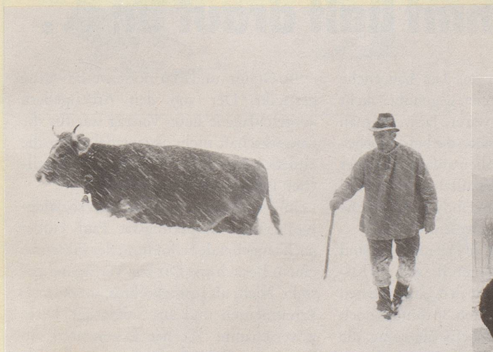
8) Weg vom Käse! In unserem gemässigten mitteleuropäischen Klima ...