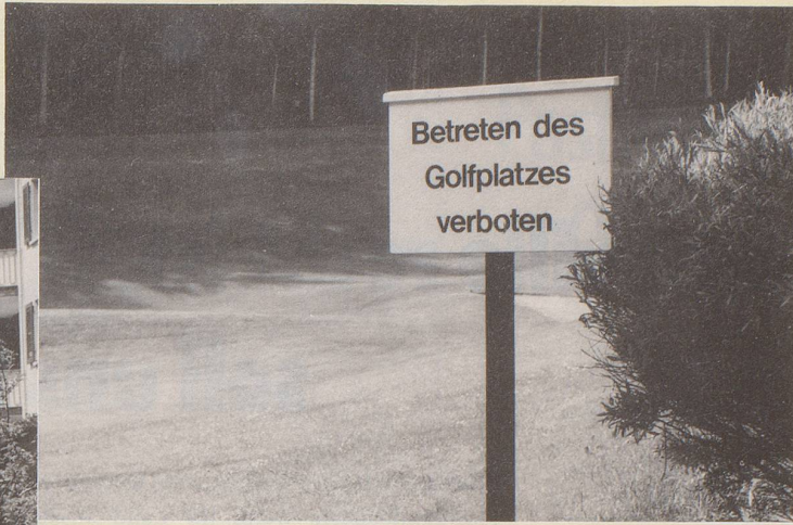
6) Bis es soweit ist, bitte mehr neue Ideen auf der Schweizer Scholle!