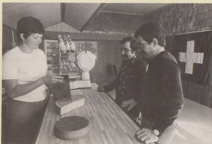
7) Die altertümlichen, fettigen Produkte sind uns Konsumenten verleidet.