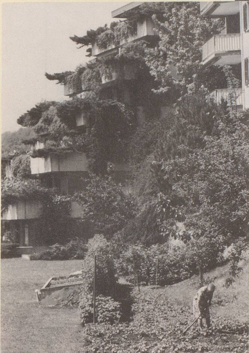
5) Wir fordern staatlich besoldete Landschaftsgärtner mit indexiertem Teuerungsausgleich.