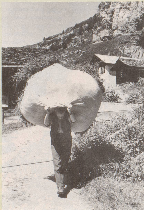
1) Wir brauchen gar keine Landwirtschaft, ...