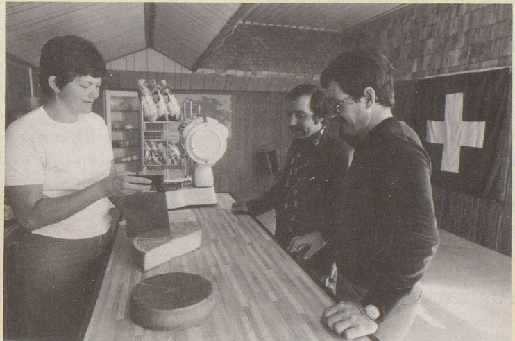
7) Die altertümlichen, fettigen Produkte sind uns Konsumenten verleidet.