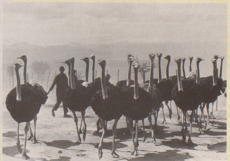
9) ... drängen sich marktgerechte Alternativen geradezu auf.