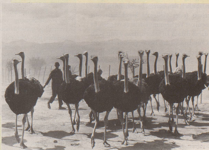
9) ... drängen sich marktgerechte Alternativen geradezu auf.