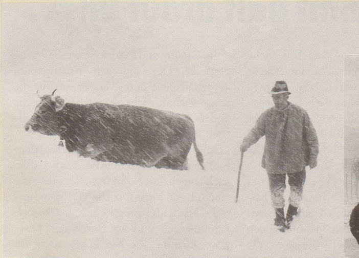
8) Weg vom Käse! In unserem gemässigten mitteleuropäischen Klima ...