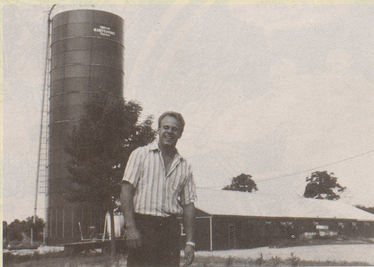
3) Was soll das bäuerliche Lamento über die Fleischpreise?