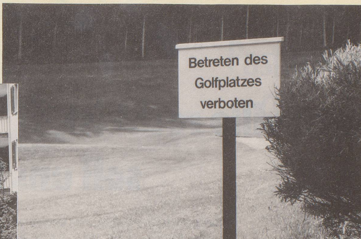
6) Bis es soweit ist, bitte mehr neue Ideen auf der Schweizer Scholle!