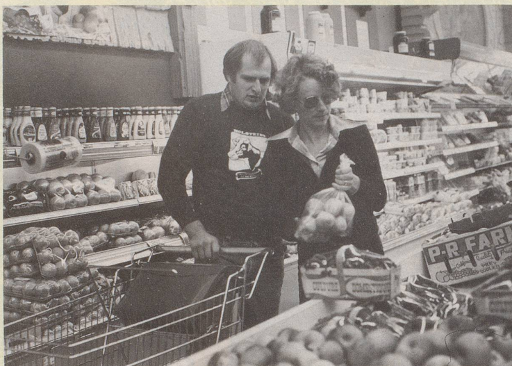
2) ... denn es gibt ja alle Nahrungsmittel im Shopping Center!