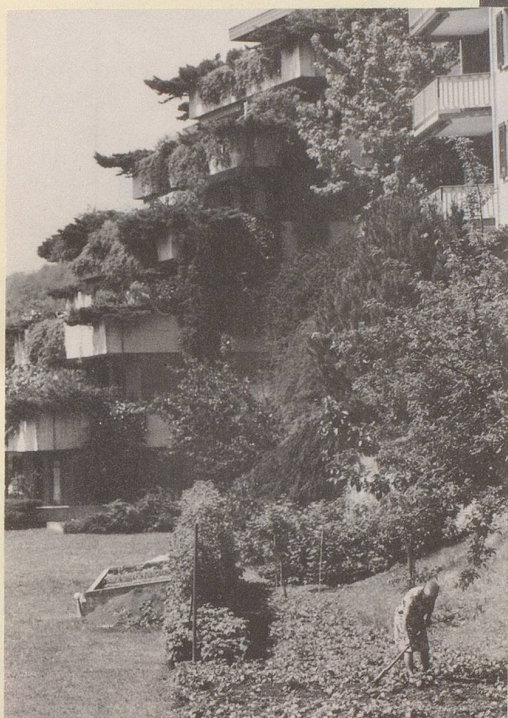
5) Wir fordern staatlich besoldete Landschaftsgärtner mit indexiertem Teuerungsausgleich.