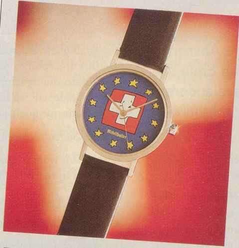
Das Zeitzeichen ...