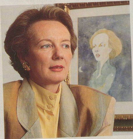
... mit Volldampf auf Europa zu ...