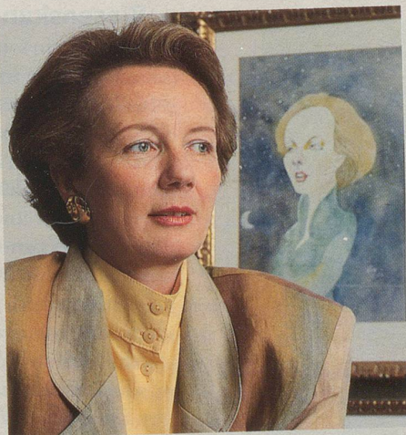
... mit Volldampf auf Europa zu ...