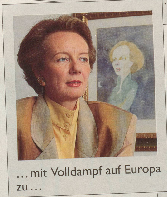
... mit Volldampf auf Europa zu ...