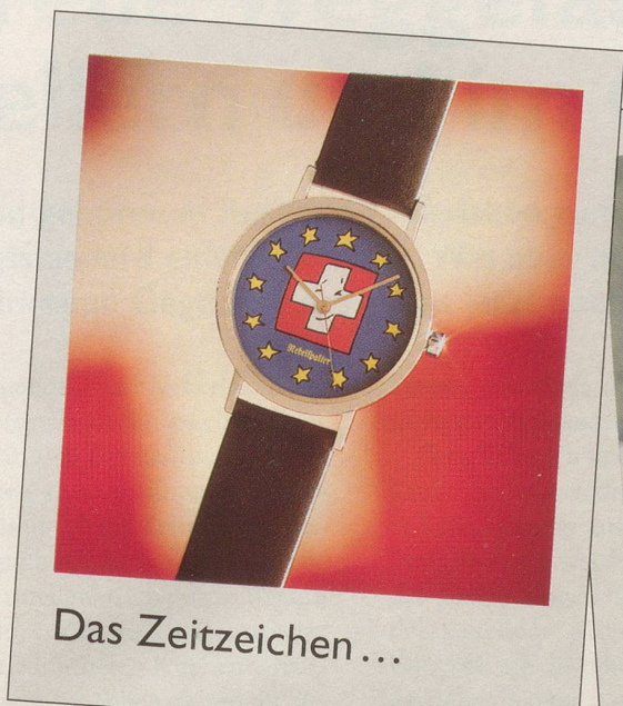
Das Zeitzeichen ...