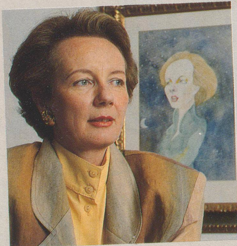
...mit Volldampf auf Europa zu...