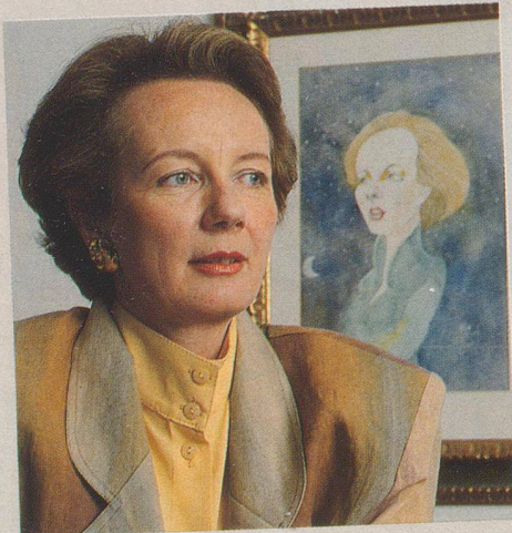
...mit Volldampf auf Europa zu...