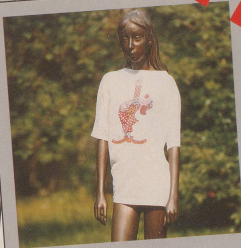
..für eiserne Ladys...