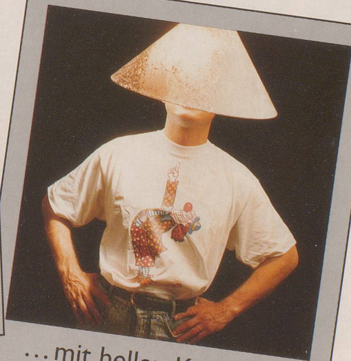
...mit hellen Köpfen.