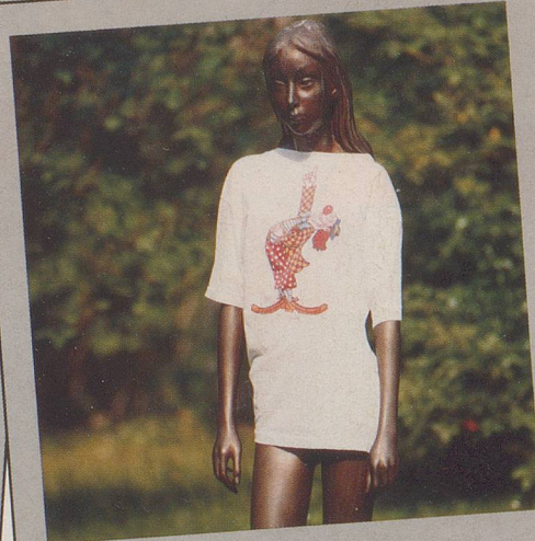
...für eiserne Ladys...