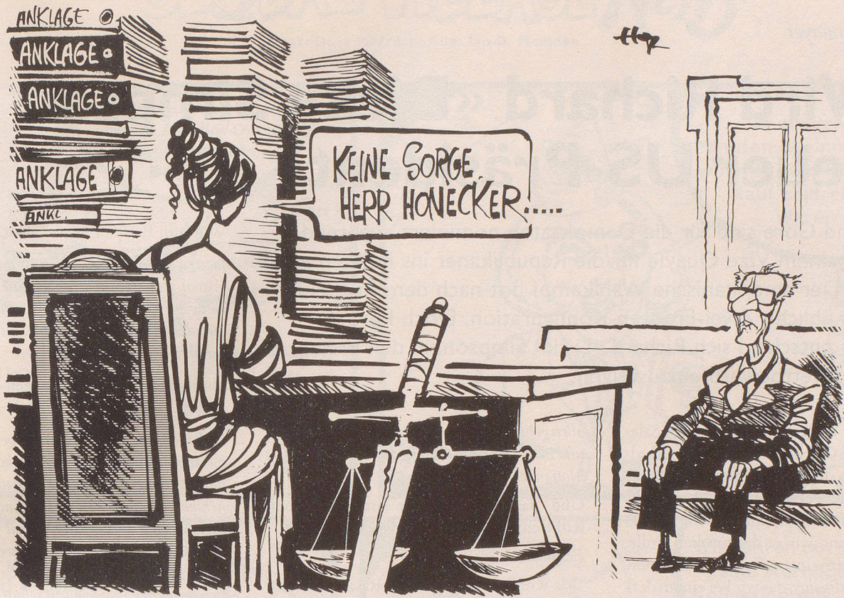
«... auf keinen Fall wird's ein kurzer Prozess!»