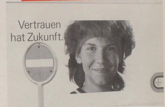
Die Schweiz existiert nicht.