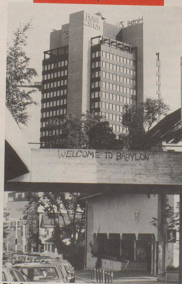
Die Schweiz existiert nicht.