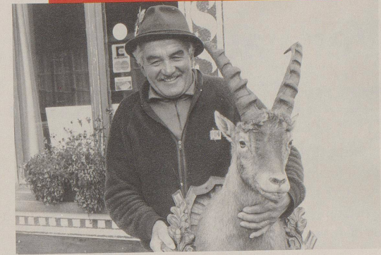
Die Schweiz existiert.