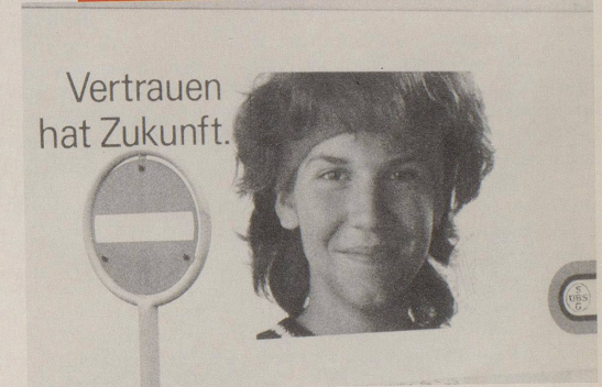
Die Schweiz existiert nicht.