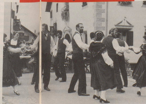
Die Schweiz existiert ...