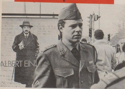
Die Schweiz existiert.