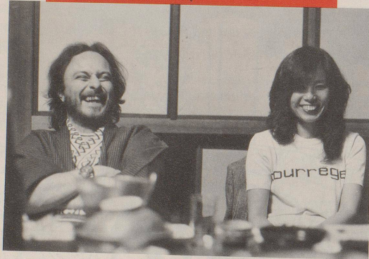
Suiza no existe.