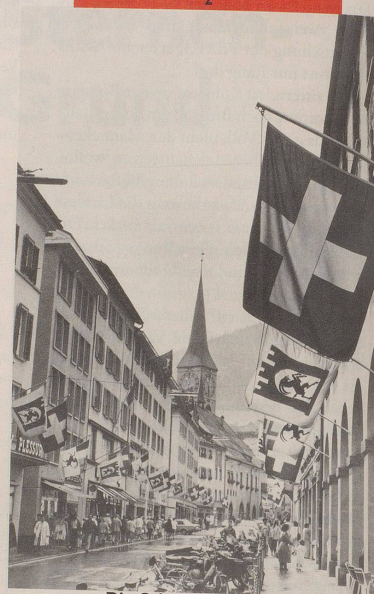
Die Schweiz existiert.