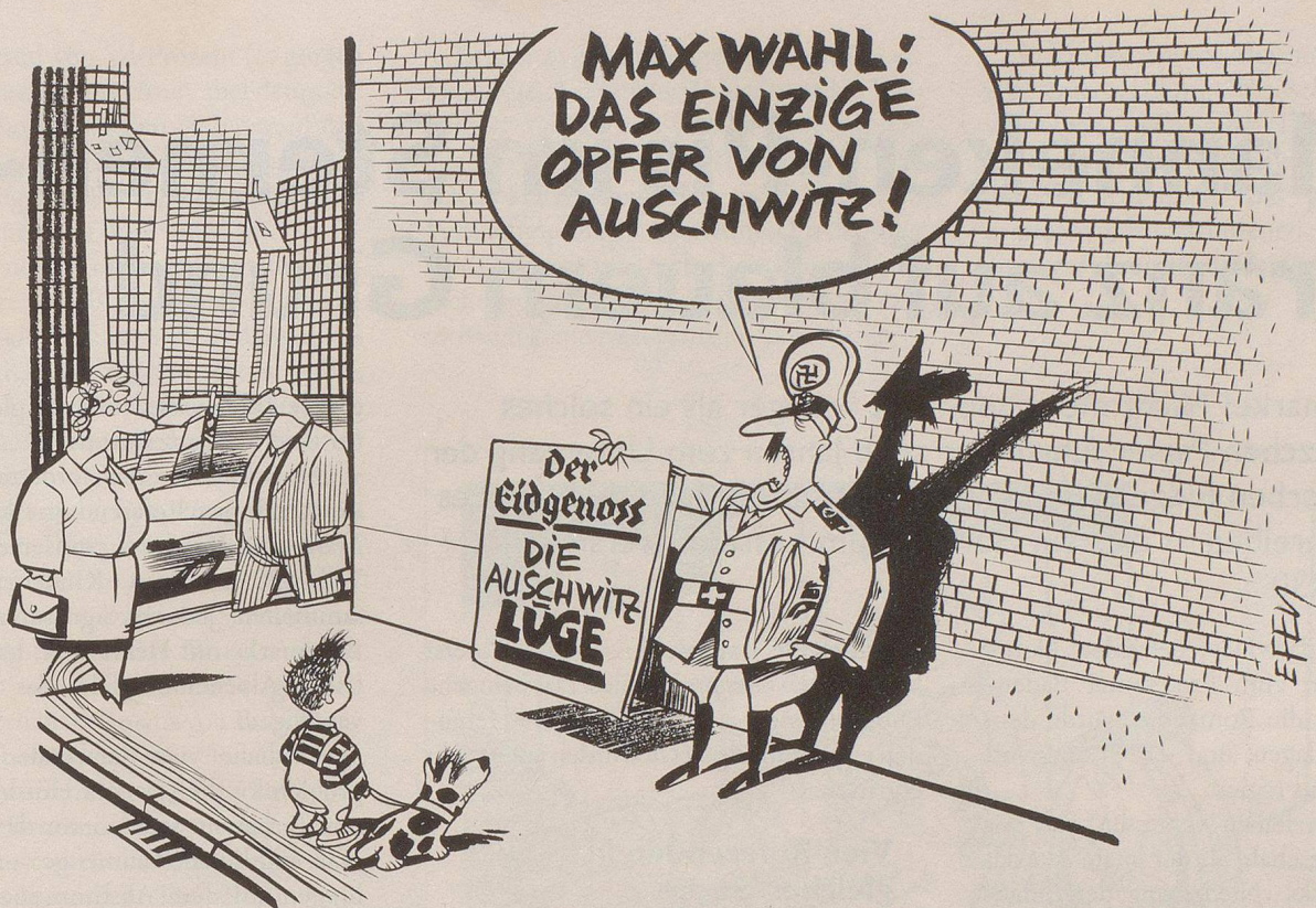
Max Wahl, ein unbelehrbarer Altnazi aus der Schweiz und Herausgeber des braunen Blättchens «Eidgenoss», ist in Deutschland wegen Volksverhetzung verurteilt worden. In der Schweiz gibt es diesen Straftatbestand nicht.