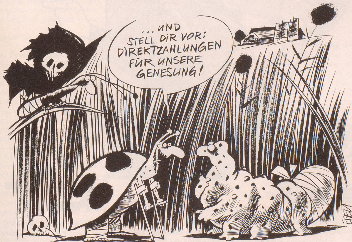
Landwirte, die nach ökologischen Gesichtspunkten arbeiten, sollen zumindest teilweise mit Direktzahlungen «belohnt» werden ...