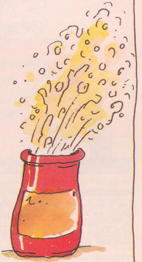
Joghurt, etwas zu light