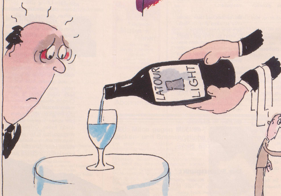
Adieu junger Mann! Man hat Sie geprüft und leider für zu light befunden.