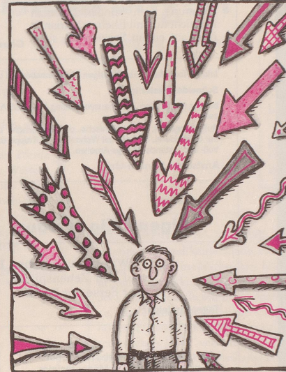
Um die Aufmerksamkeit auf sich zu lenken, sammelt der unscheinbare Klaus W. allerlei Pfeile.