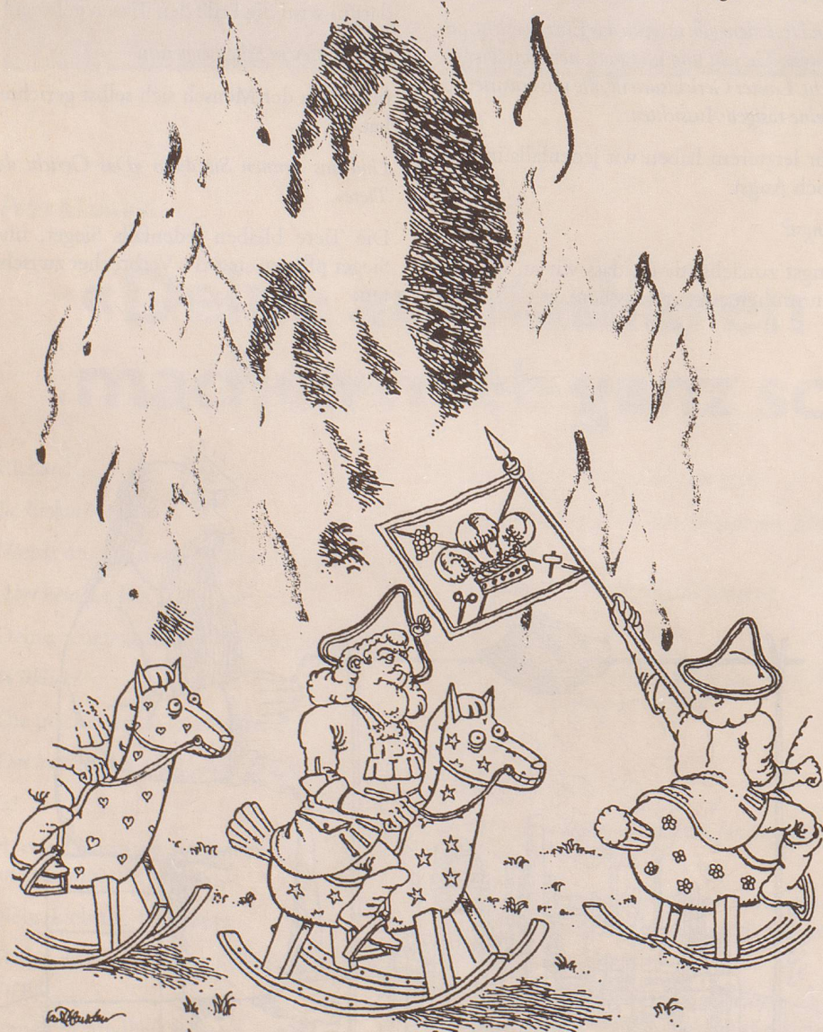
Während am Zürcher Sechseläuten die stolzen Reiterscharen der Zünfte um das Flammenmeer herumgalopieren, ...

Begabung in Musik und Intrigieren sicherten ihm die Karriere. Louis XIV. zwang