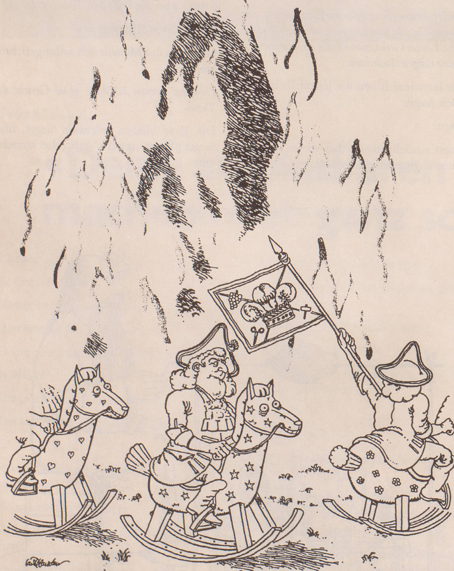
Während am Zürcher Sechseläuten die stolzen Reiterscharen der Zünfte um das Flammenmeer herumgalopieren, ...

Begabung in Musik und Intrigieren sicherten ihm die Karriere. Louis XIV. zwang