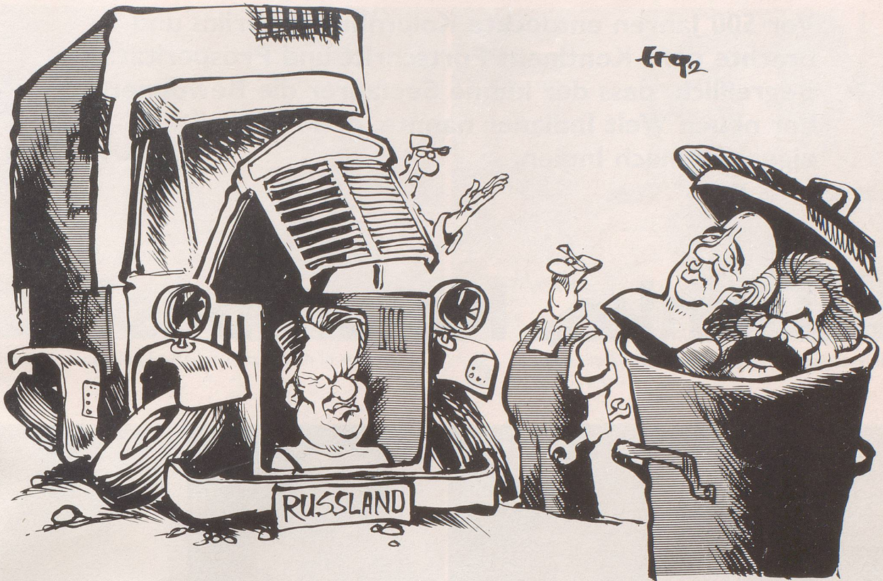
«Ich glaube, mit dem geht's wieder nicht!»