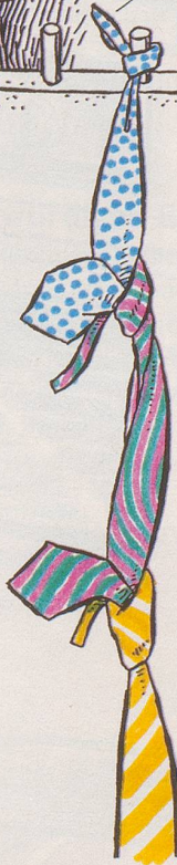
Ich bin praktisch veranlagt