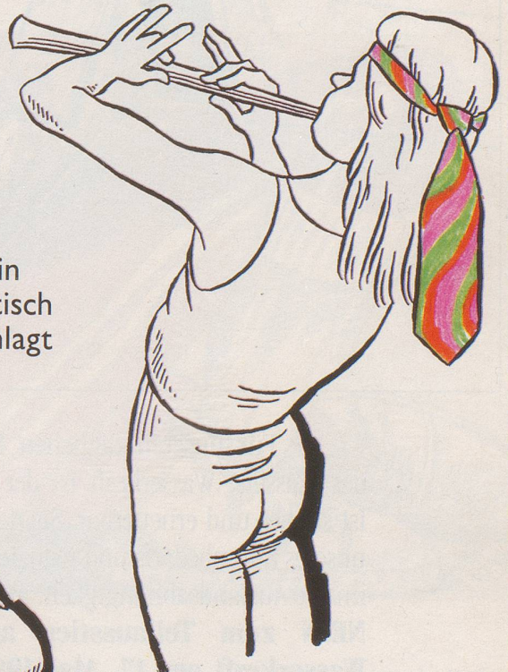
Ich pfeife auf meine Umgebung!