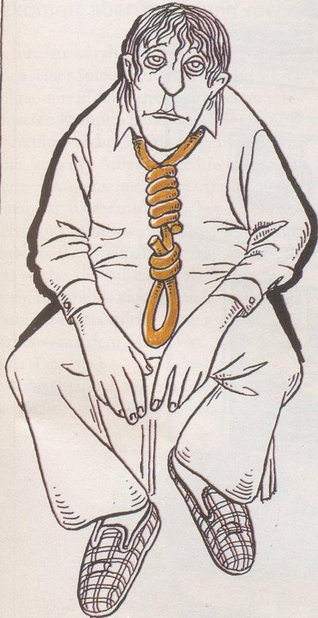
Ich fühle mich saumässig!