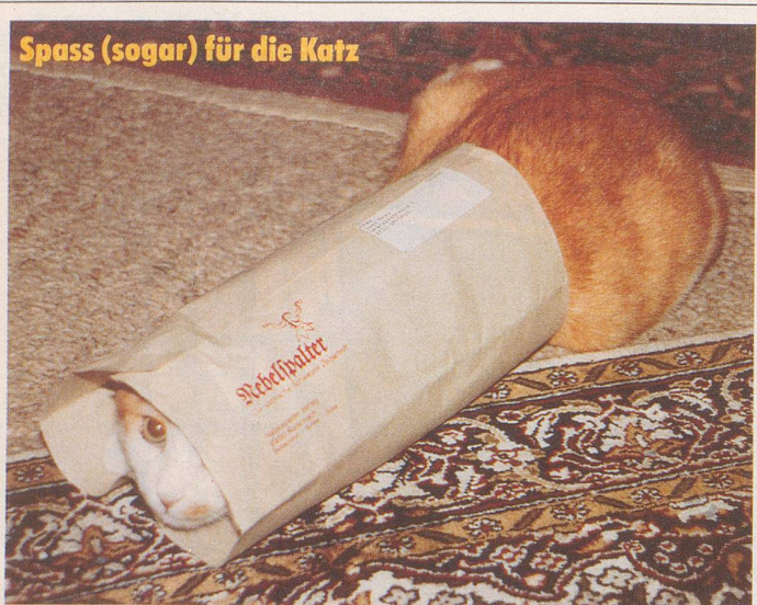
Am Nebelspalter hatte sogar unser Kater Butzi Spass. Was dabei herauskam, sehen Sie auf der Foto.